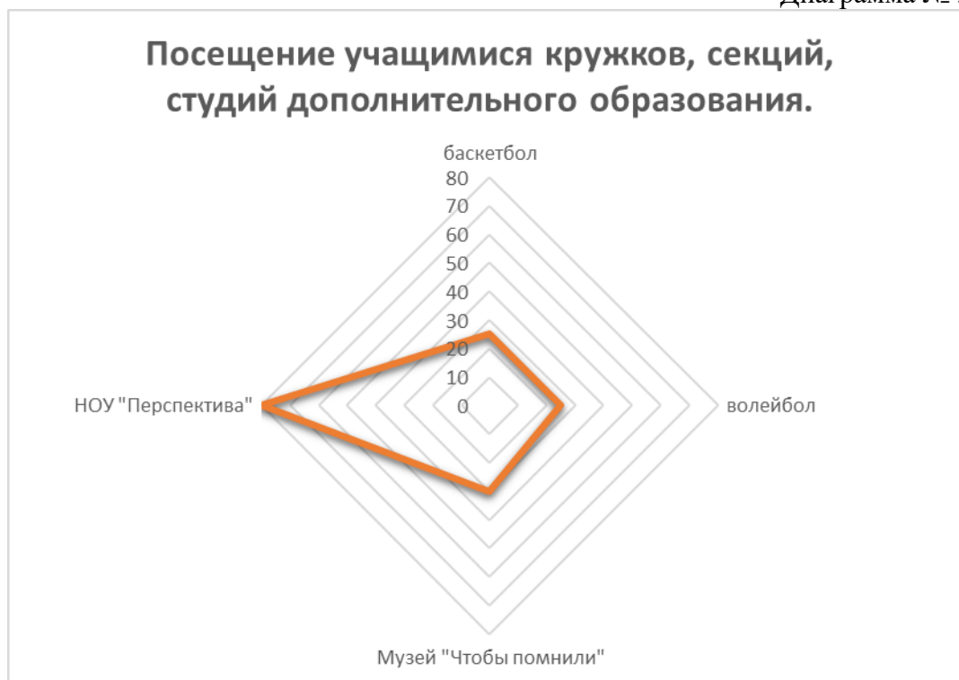
Диаграмма № 3