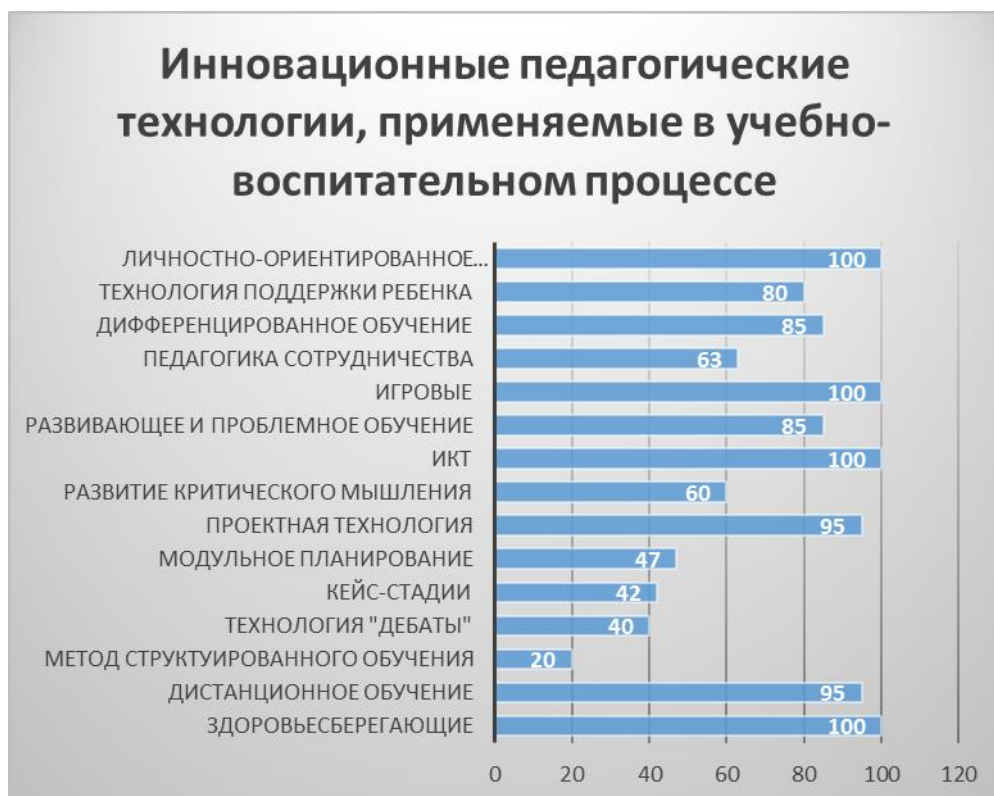
Диаграмма № 2